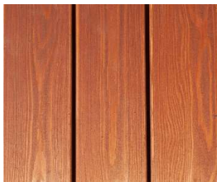
Lärche - tabakbraun