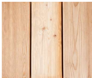
Lärche - natur